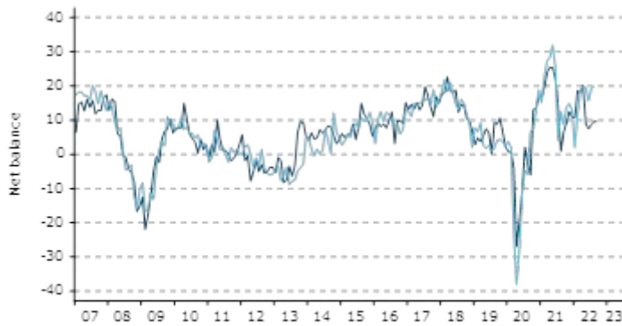
==AiG surveys, fitted to NAB business conditions —NAB business conditions