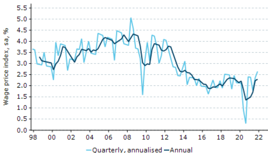
図表 1. 賃金価格指数は緩やかに加速

経済学者ロバート・ソローは1987年に「生産性統計以外の至るところでコンピューター時代の到来が見られる」と述べた。豪州でこれに当てはまるのは、賃金上昇は統計以外の至る所で起きているということだろう。確かに、賃金価格指数（WPI）の前年比上昇率が（依然として不十分な）パンデミック前の水準に戻ったということは、深刻な労働力不足と賃金上昇に関する多くの逸話と対照的だ。